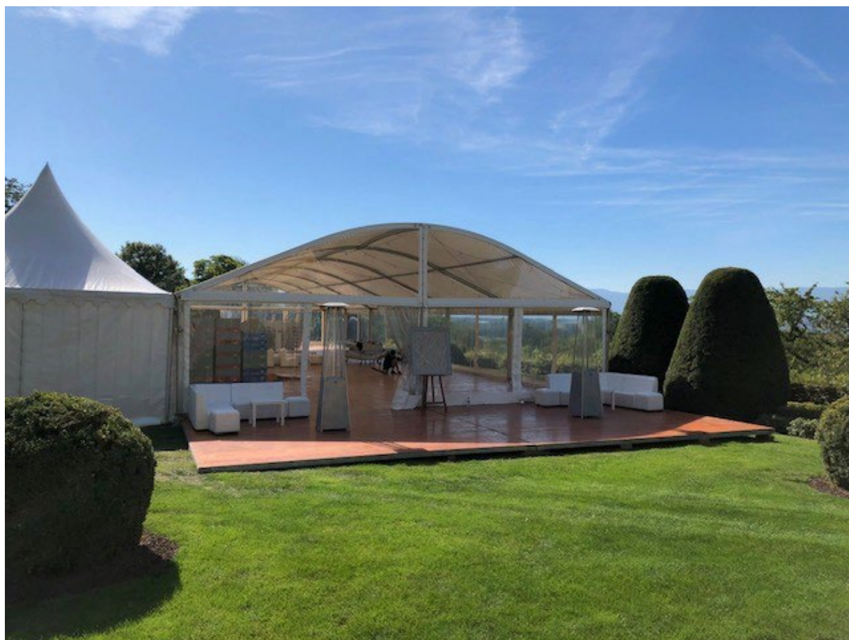
Photo d'un Chapiteau installé dans les jardins à l'occasion de la Fête annuelle du Club