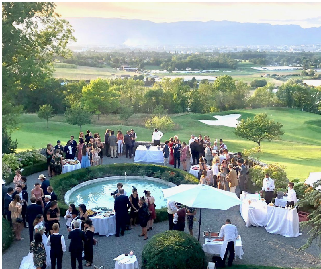
Photo d'un Cocktail (vin d'Honneur) prise lors d'un mariage organisé par le Club