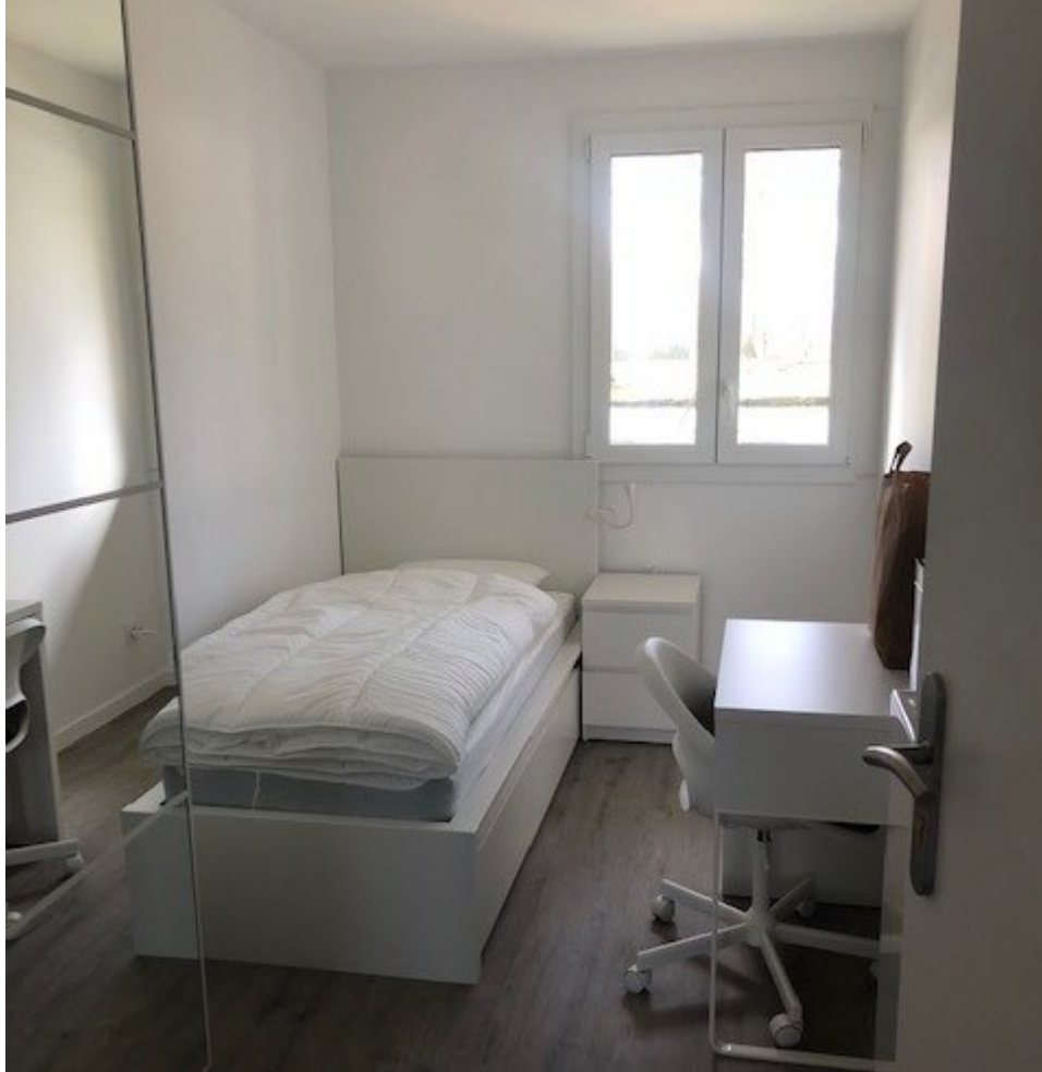
Photo de la chambre individuelle entièrement rénovée