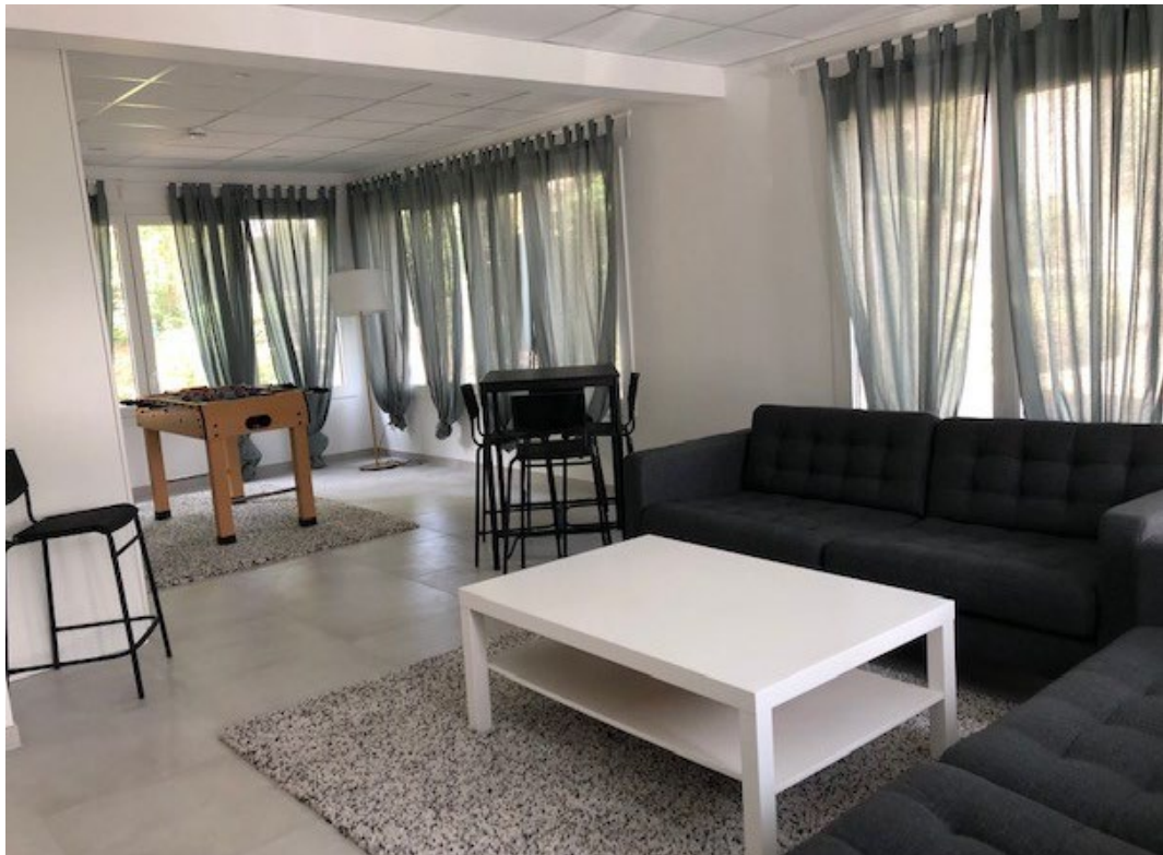
Photo de la salle de repos avec Ecran TV et Baby-Foot