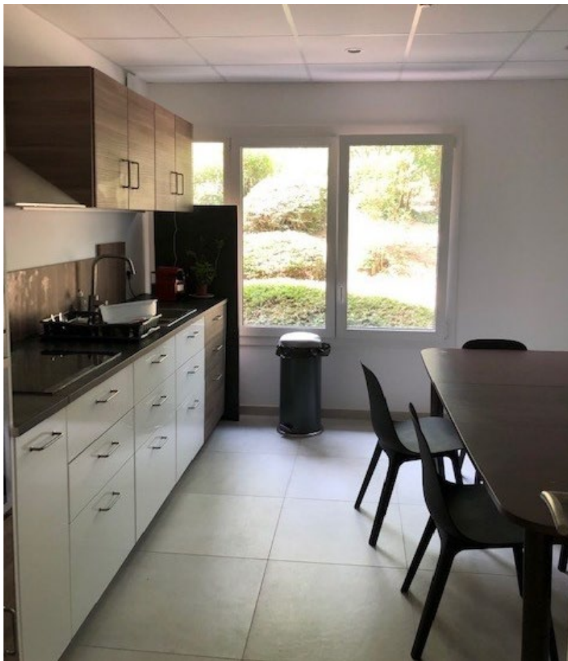
Photo de la cuisine STAFF entièrement équipée