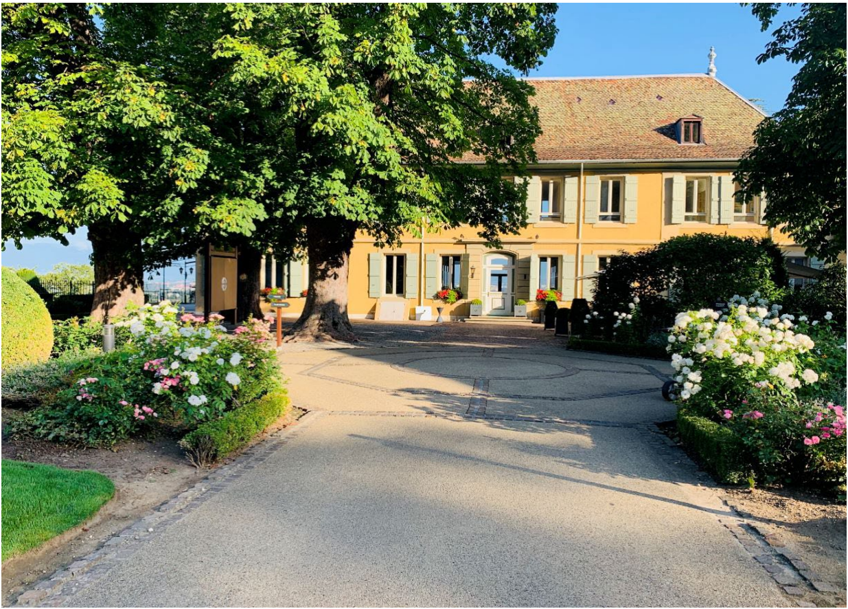
Photo du Château du Club House