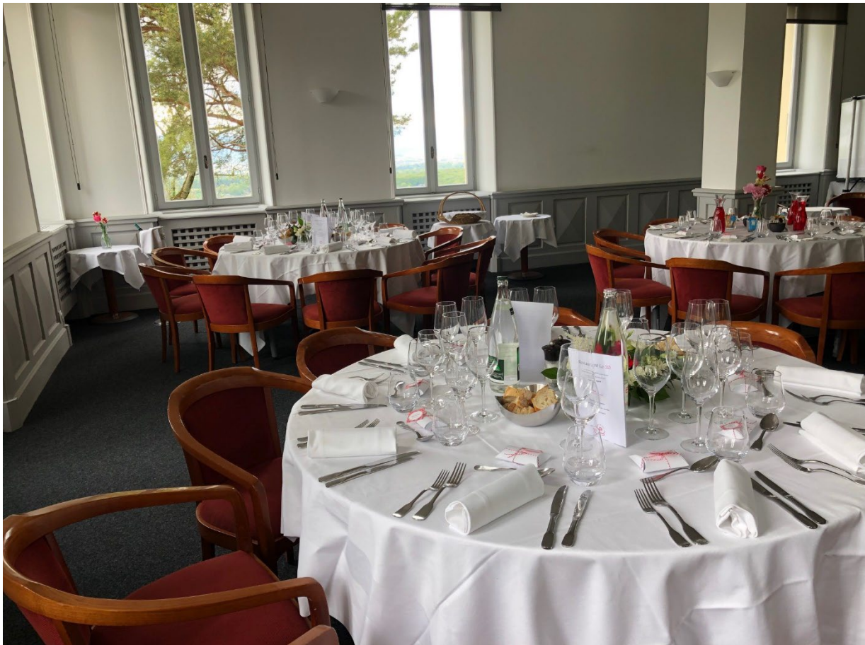
Photo d'un salon de réception préparé pour un événement privé